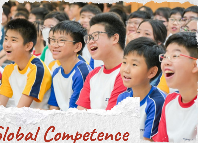
Global Competence Cup