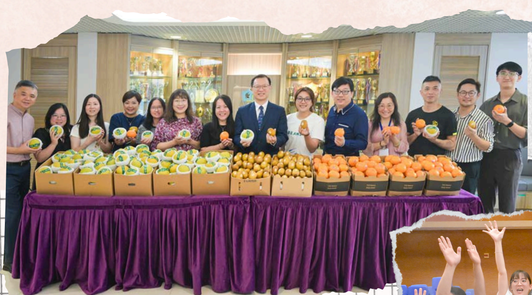
Fruit from PTA