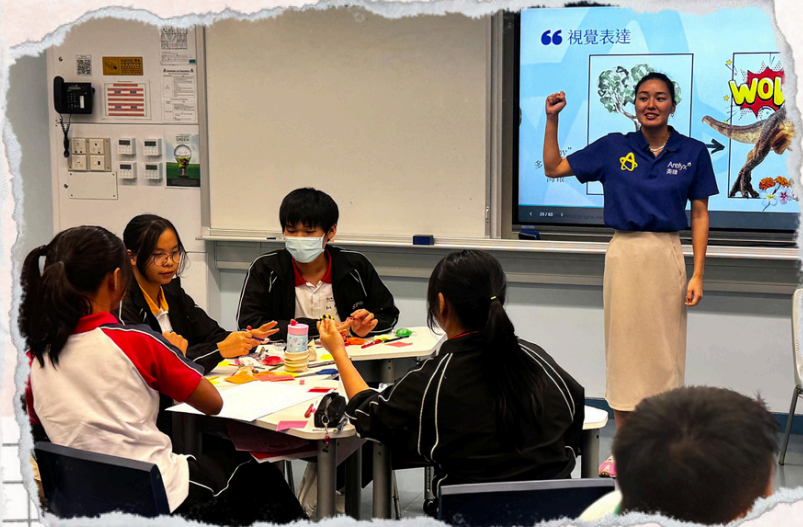
Student Leaders Training by Ms. Yvette Kong, Former Hong Kong Olympic Swimmer