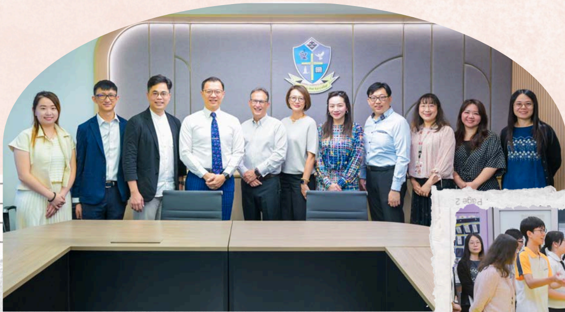
Visit from The University of Toronto