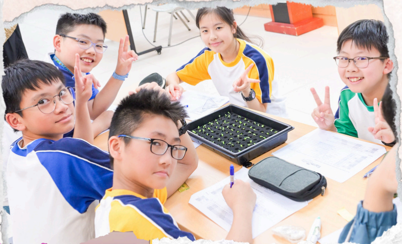
Smart Farming @ Harvest Lab