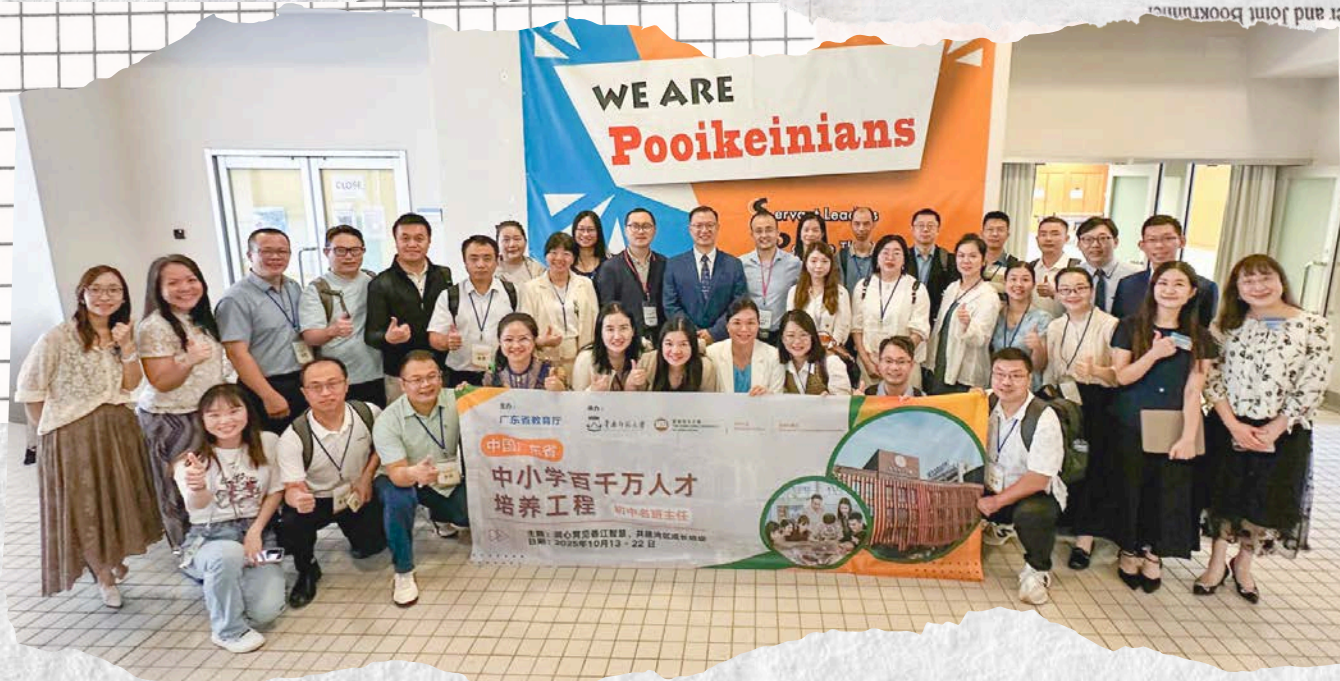
Visit of the Delegation of "Million Talent Development Initiative"